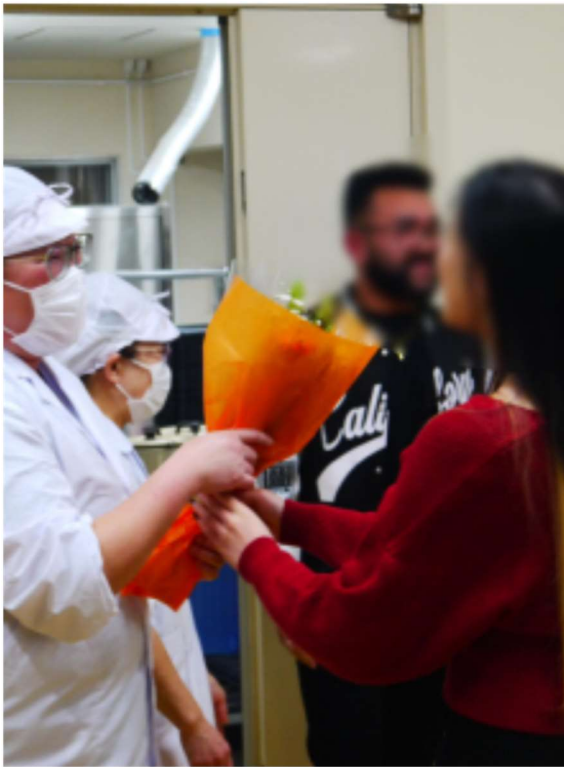
調理員さんへの花束贈呈

2月14日(水)に定時制課程の予餞会(卒業生を送る会)を開催しました。開催に先立ち、食堂にて給食の調理員さんたちに4年生(卒業生)の代表生徒から感謝の花束を贈りました。予餞会では生徒会役員が中心となり、全校生徒でゲームを行った後、思い出のスライドを上映し、楽しいひと時を送りました。