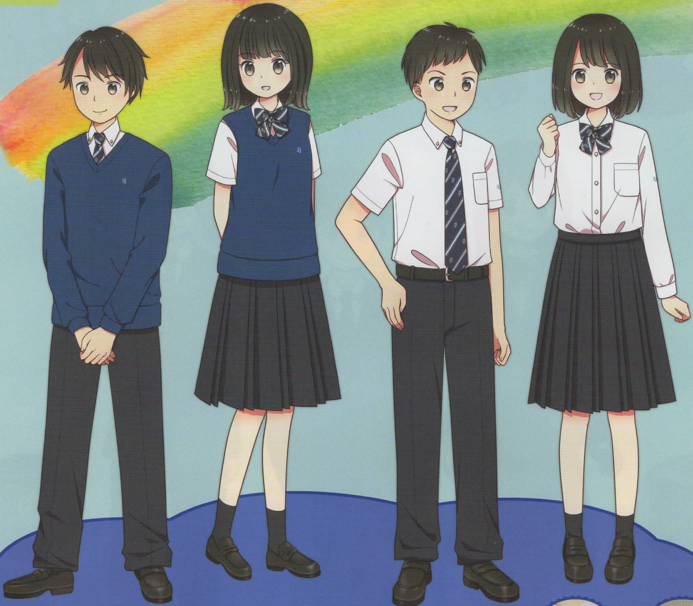
ニットセーター・ベスト着用時